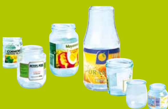
Les bocaux et les pots en verre