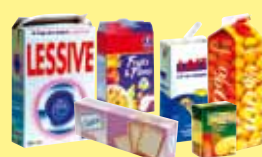
les boîtes et petits cartons d'emballage