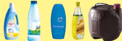
les bouteilles, flacons et bidons en plastique opaque avec leur bouchon