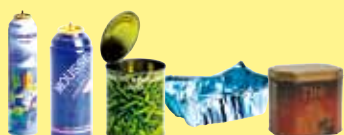
les bidons, aérosols, boîtes métalliques et barquettes aluminium

Portez les gros cartons à la déchetterie.