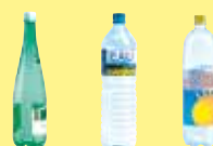
les bouteilles transparentes en plastique avec leur bouchon